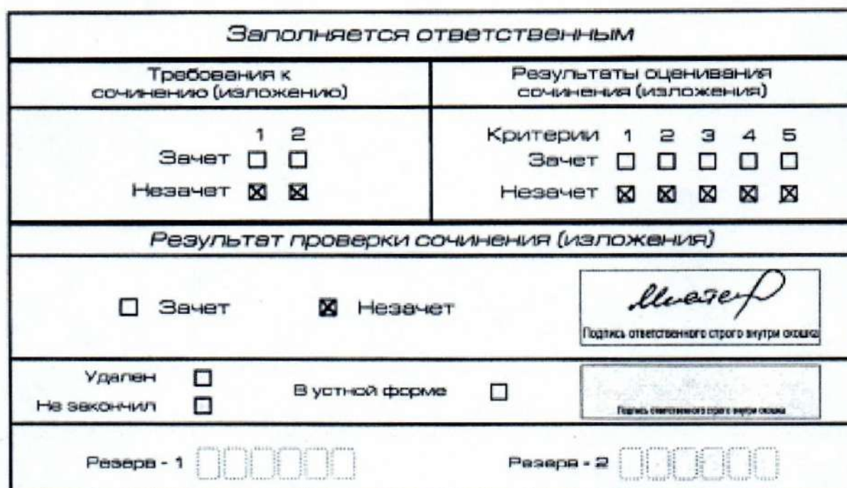
Рис. 8. Область для оценки работы

выставляется «незачет». В поле «Результат проверки сочинения (изложения)» ставится «незачет» (рис. 8).