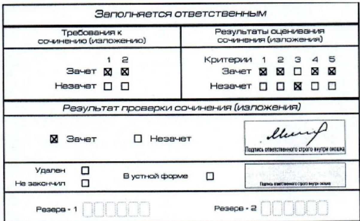
Рис. 11. Область для оценки работы

После окончания заполнения бланка регистрации ответственное лицо ставит свою подпись в специально отведенном для этого поле.