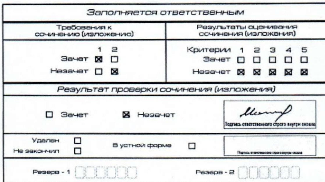
Рис. 9. Область для оценки работы

Если итоговое сочинение (изложение) соответствует требованию № 1 и требованию № 2, то выставляется «зачет» за выполнение требования № 1 и требования № 2. Указанные сочинения (изложения) далее оцениваются по критериям.