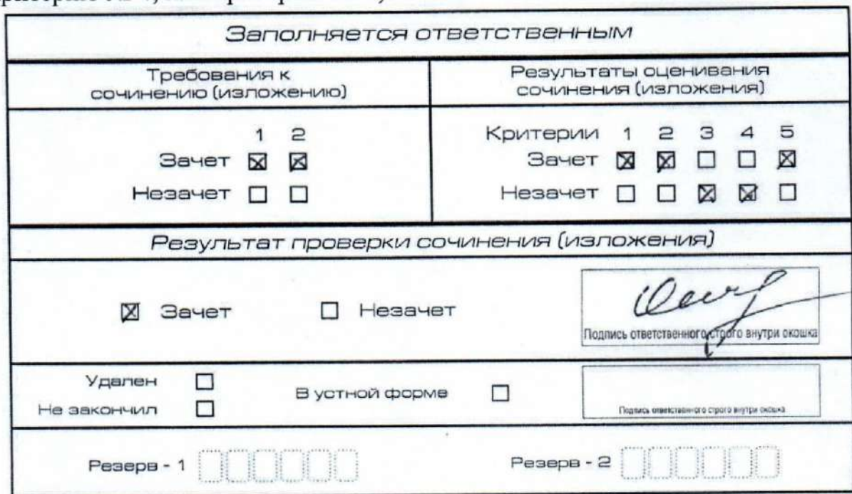
Рис. 10. Область для оценки работы

– по одному из трех других критериев (критерию № 3 или критерию № 4, или критерию № 5).