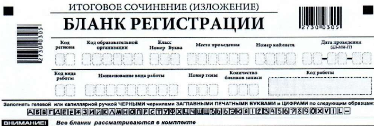
Рис. 2. Верхняя часть бланка регистрации

По указанию члена комиссии участником заполняются все поля верхней части бланка регистрации (табл. 1), кроме полей «Количество бланков записи» и «Код работы».