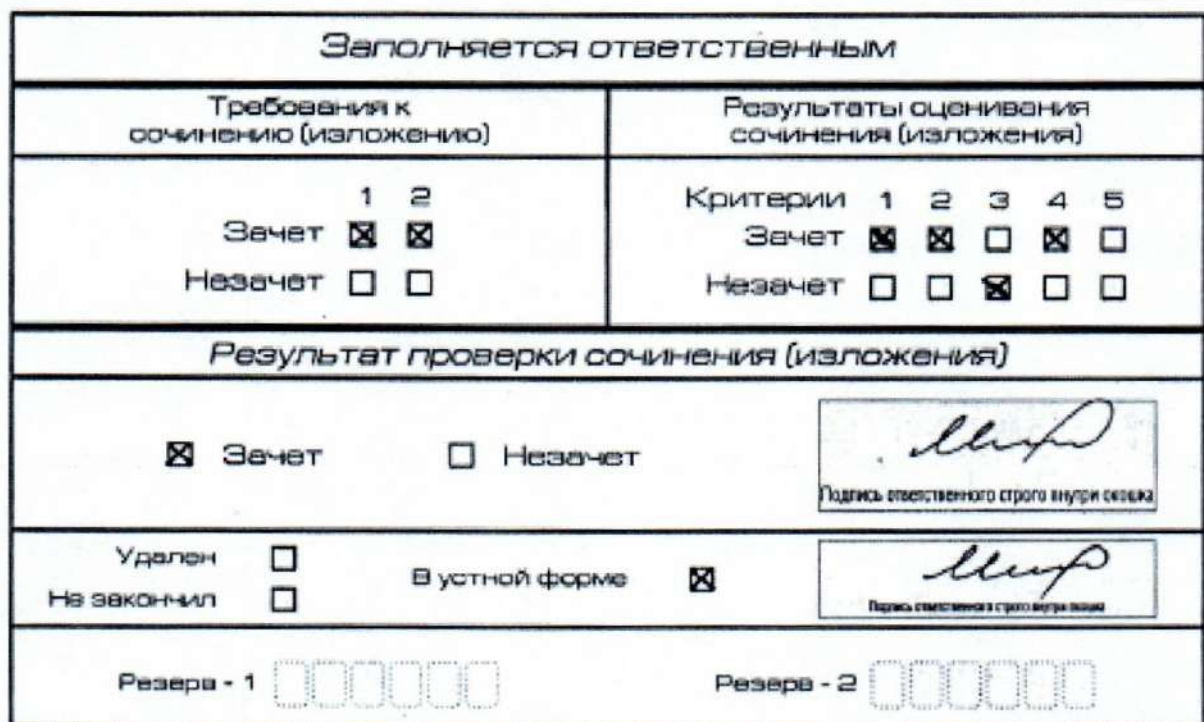
Рис. 12. Область для оценки работы сочинения (изложения) в устной форме

После окончания заполнения бланка регистрации ответственное лицо ставит свою подпись в специально отведенном для этого поле.